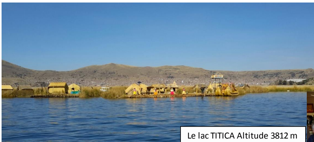
Le lac TITICA Altitude 3812 m

Ce 10 Octobre, nous nous sommes rencontrés pour notre sortie annuelle "Découverte du Monde".