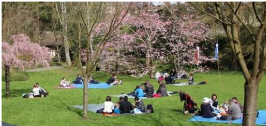
La fête des cerisiers au jardin oriental de Maulévrier (Maine-et-Loire)